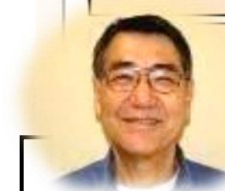
<館長よりひとこと>

人間歳を重ねると、多くの自分の経験や成功体験を通して、判断するようになります。これは大切なことですが、一つ間違えると他人の意見を聞かなくなったり、思考の視野が狭くなったりします。テニス界の大スターロジャーフェデラーが日本人記者に「なぜ日本のテニス界からは世界的な選手が出ないのか」と質問された際、「何を言うんだ？ 日本にはクニエダがいるじゃないか」と返しました。パラスポーツ車いすテニスの国枝選手を称えたコメントです。ふたりともに生涯グランドスラム+オリンピック金メダリストですね。質問した記者は少し恥ずかしい思いをしたでしょう。人から言われて気づく素直に「そうですね」と言えるようにしたいと思いますし、いつも自分の視野を広く持ちたいと思います。